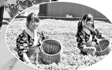
▲お茶娘写真撮影会