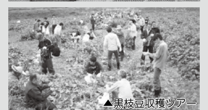
▲黒枝豆収穫ツアー