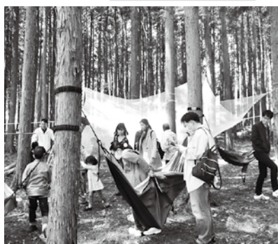
▲トランポリンネット