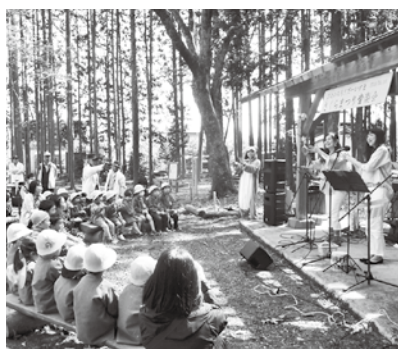
▲おとわの森に響く演奏