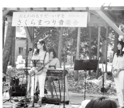
▲ふらうむじーくの皆さん