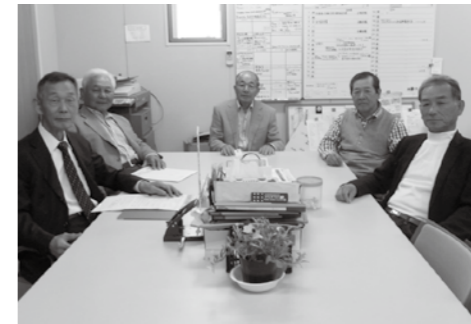
▲会長、副会長、会計の皆さん

また、味間地区まちづくり協議会は、毎週火・金曜日の午前9時～午後1時に開所していますので、お気軽にお越しください。