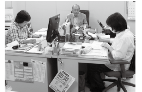
▲まち協の事務所と事務局の皆さん