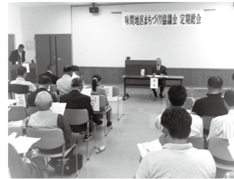
▲定期総会のような様子